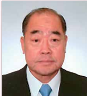
2015～2017年国際理事候補者