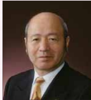
ライオンズクラブ国際