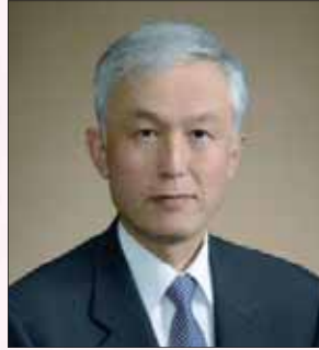
第 61 回地区年次大会