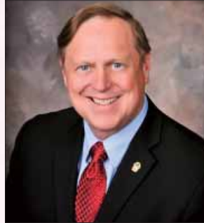
ライオンズクラブ国際協会