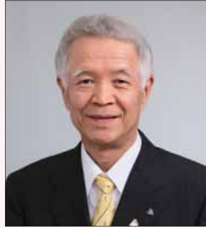
姫路市長 石見利勝

ライオンズクラブ国際協会 335-D 地区第 61 回地区年次大会のご盛會を心からお喜び申し上げます。