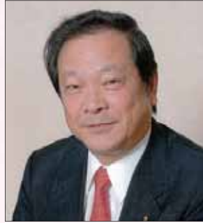
ライオンズクラブ国際協会