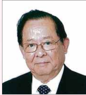
ライオンズクラブ国際協会