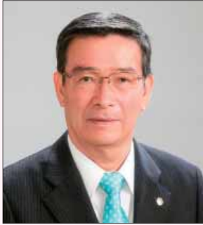
2015～2017年国際理事候補者