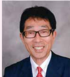
ライオンズクラブ国際協会