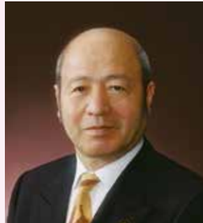
ライオンズクラブ国際協会