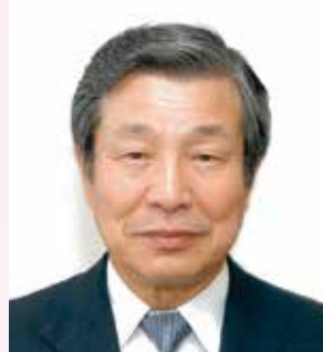
ライオンズクラブ国際協会