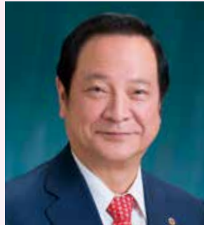
ライオンズクラブ国際協会