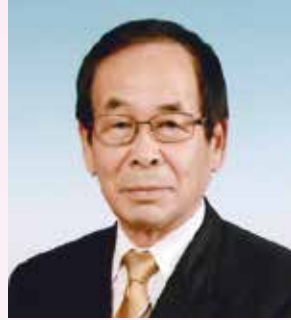
第 62 回地区年次大会