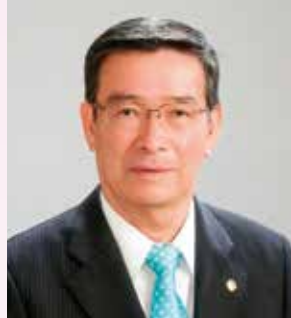
ライオンズクラブ国際協会