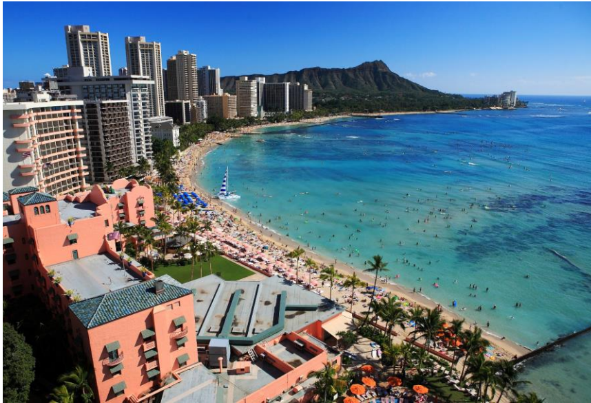
▲ワイキキビーチ

※ 燃油サーチャージ 約17,000円、また、国内空港施設使用料(関西空港3,040円及び海外空港諸税約8,000円(コースや航空会社により異なります。))が別途必要です。上記は2015年1月5日時点での金額です。 これらの額は、今後増額された場合には不足分を追加徴収、減額された場合には減額分を返金させていただきます。