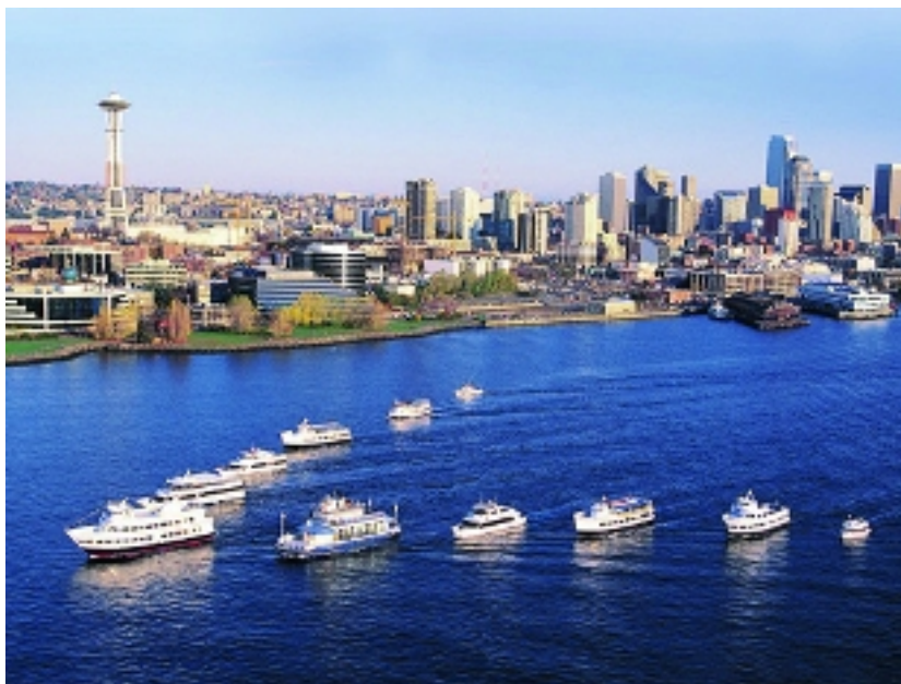
写真はシアトルの街並み