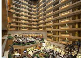
吹き抜けで解放感溢れるロビー