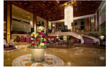
オリエンタルな雰囲気のロビー